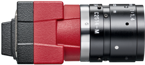
Model without hardware options