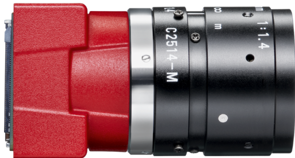
Model without hardware options